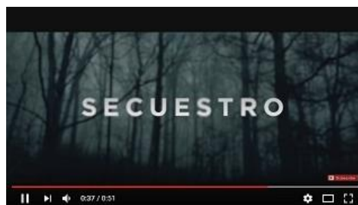
SECUESTRO , de Mar Tarragona Rodar y Rodar Cine