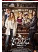
MI PANADERIA EN BROOKLYN Director: Gustavo Ron Bullet Pictures, La Canica Films, El Capitan Pictures