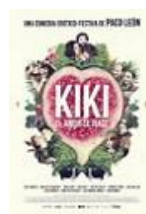
KIKI, EL AMOR SE HACE Director: Paco León Vértigo Films, Telecinco Cinema