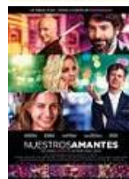
NUESTROS AMANTES Director: Miguel Ángel Lamata Bemybaby Films