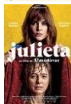
JULIETA Director: Pedro Almodóvar El Deseo