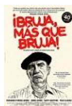
¡BRUJA MÁS QUE BRUJA! Director: Fernando Fernán Gómez Laro Films